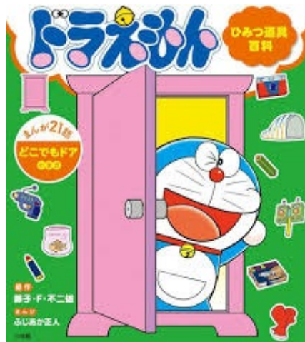
(Doraemon with to anywhere can trip magical door)