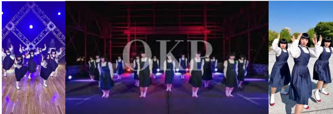
(above: Japanese mysterious O`kappa-hair dancing army named “Avantgardey”)

“Mysterious, Non!! Doubtful you, ♪The One♪?”