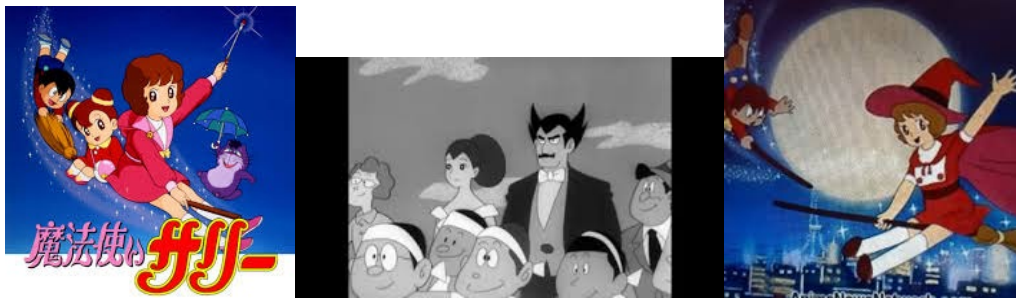
(above: Japanese animation: “Sally the witch”)

“Wow, great!! Japanese ♪animation・Manga culture♪!!”