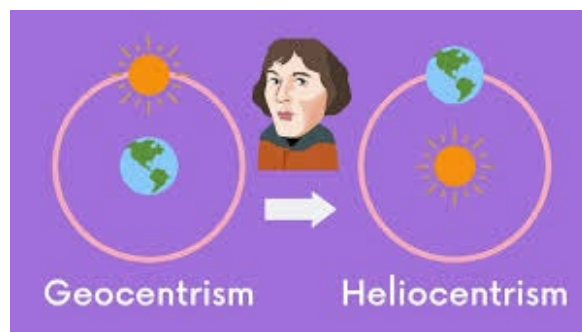
(above, calling in Japanese “Tendo-setsu”→”Chido-setsu”)