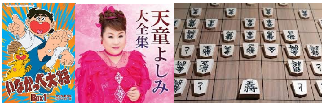
(above: Japanese animation “Country boy the champion”, theme song singer “Tendo Yoshimi”