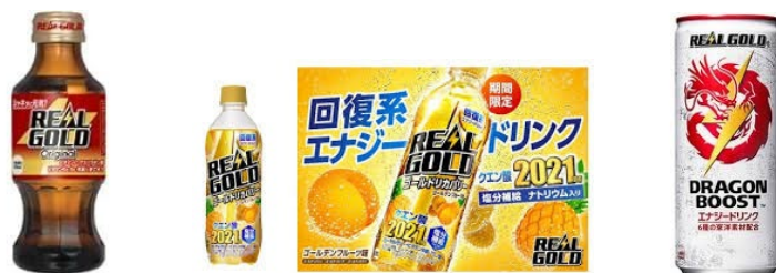
(“Real Gold”: Takeda medical co,ltd stamina drink)