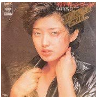
(“Imitation Gold”: Momoe Yamaguchi`s hit song)