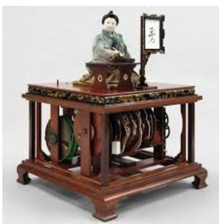
(Giuemon`s machine doll, above doll moving, under part is machine block for above doll moving)