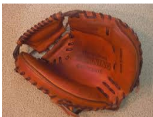
(“Khamcham Zuppo-ri”, catcher mitt)

“ ♪Oh, My, Good!!♪, about a kidding story? ”