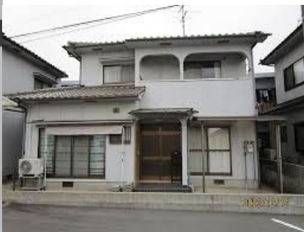
(This year standard)