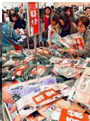
(This year here and there)