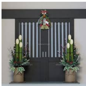
(Last year standard)

“2025, beginning of his year, several uncomfortable signals in Japan!?”