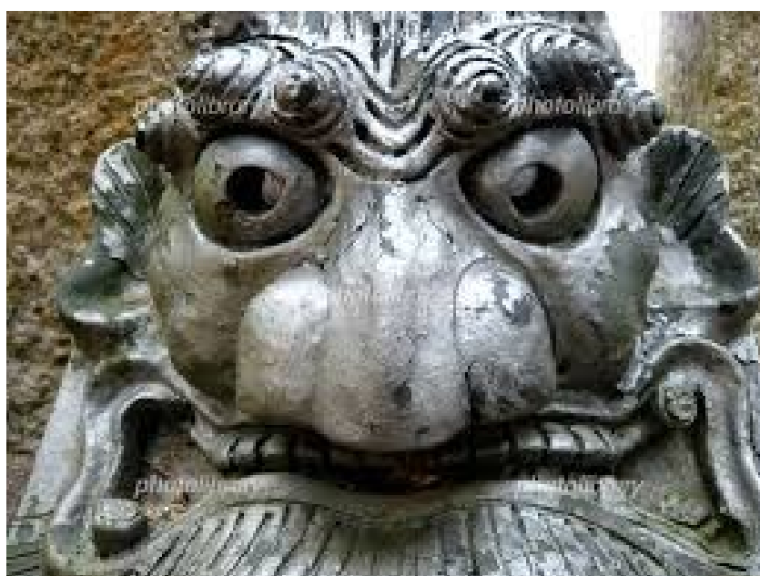
(above: the imagination of “Oni-Gawara-Sanda- Yuh,” below in the article coming out, the name)

“It`s not from me!! It`s not hit original point!!”