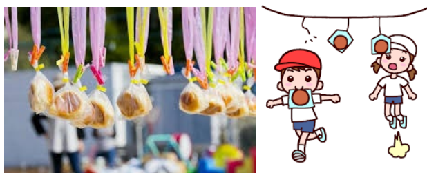
(Ampan(=1, ike a sweets taste bread) Kui running race)

“Don Qui Hote Boss, perhaps, in this country original proper game in athletic festival, “Ampan Kui race” (reference: below illustration and photo), might it be, because of .